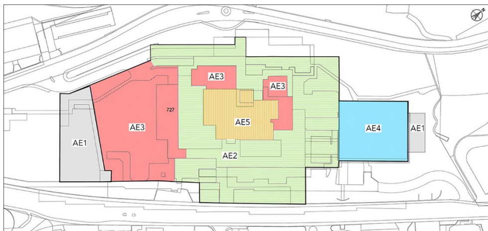
Figura 2. Ingombri planovolumetrici concessi