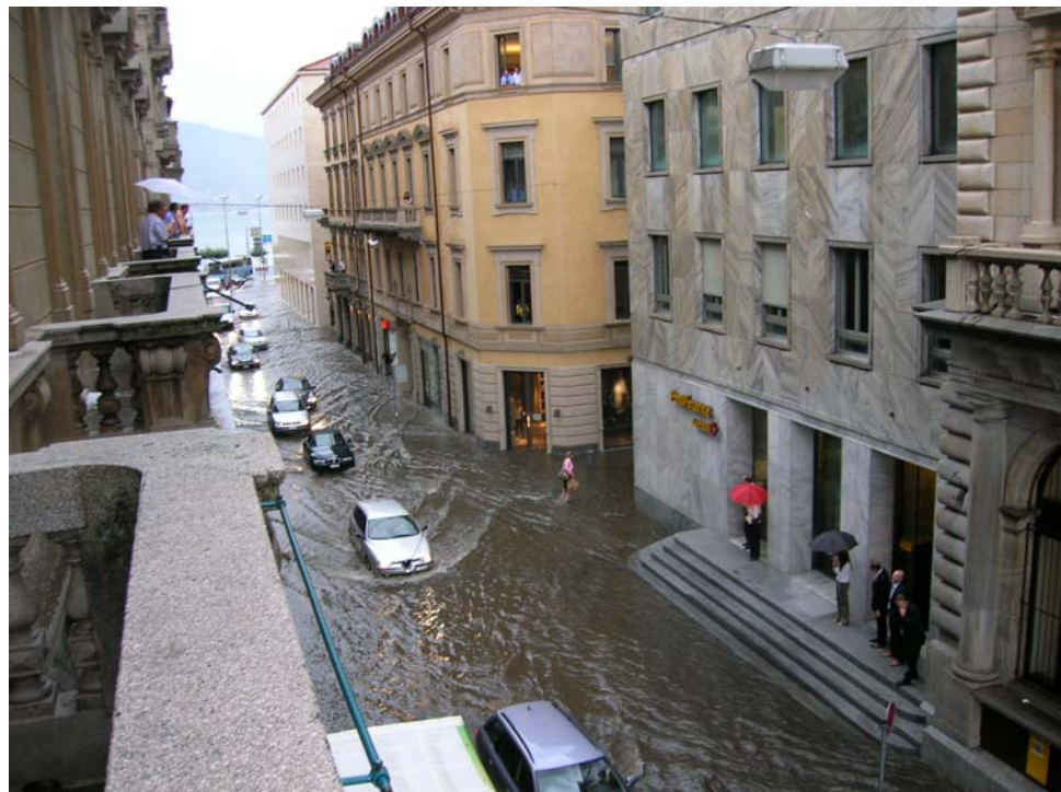
Accesso uffici postali