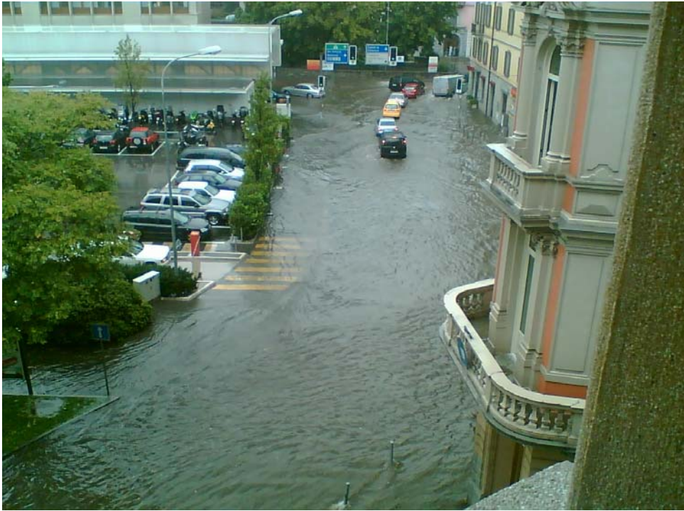
Via della Posta