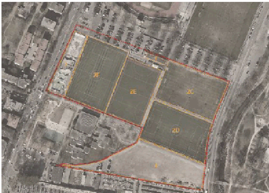
Figura 1: situazione attuale

La restante superficie a ovest viene adibita a parcheggio e garantisce l'accesso alle cappelle laterali del cimitero mediante una via a fondo chiuso che costeggia il perimetro sud-est della scuola Gerra.